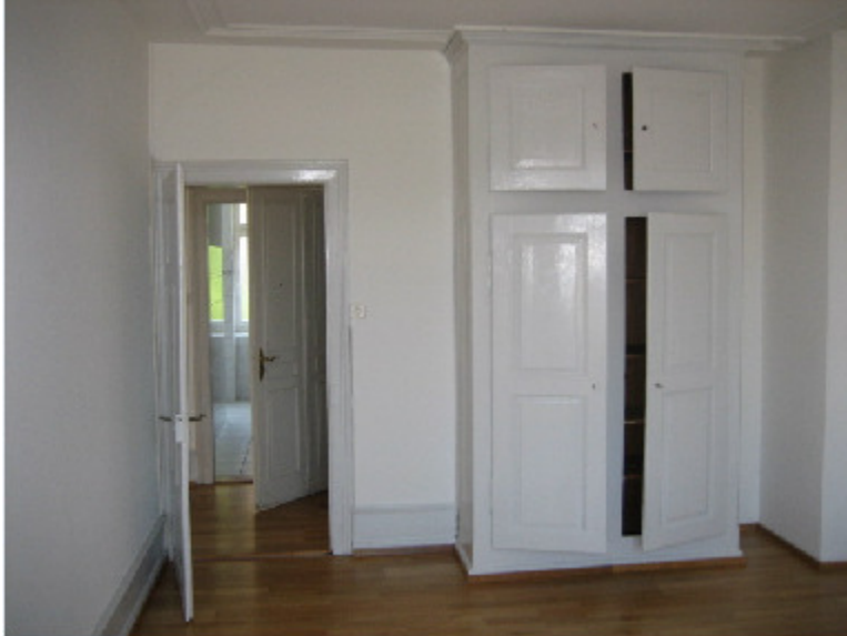
Schränke und ihre Türen. Bolleystr. 42, 8006 Zürich (1906)