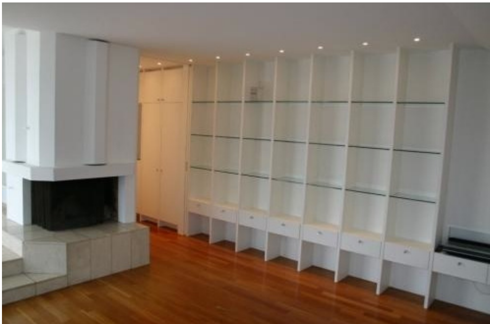
Büchergestelle und ihre Regale. Rütistr. 56, 8032 Zürich