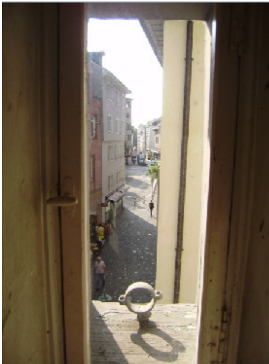
Fenster und Fenstergriff. Fenderläden und ihre Einhaköse. Oberdorfstr. 5, 8001 Zürich