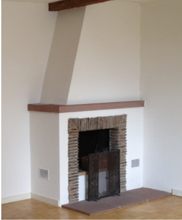
Cheminée und sein Abzug. Malzgasse 9, 4052 Basel