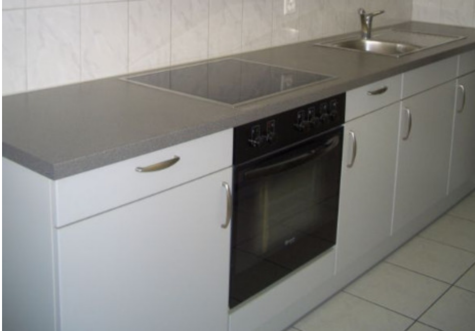
Küchenschränke und -schubladen und ihre Griffe. Isteinerstr. 98, 4058 Basel