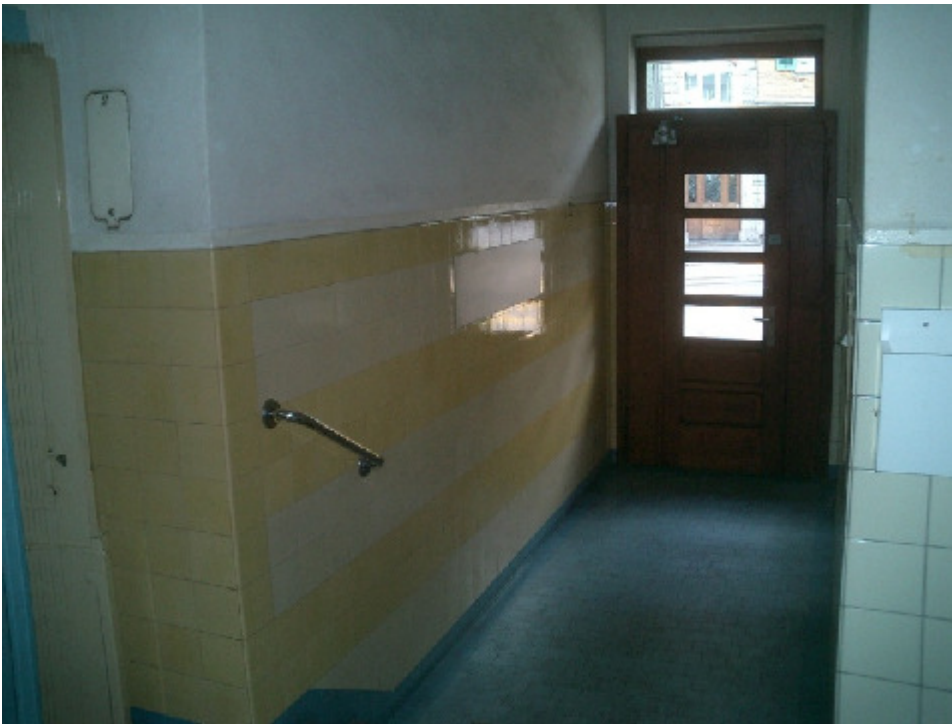
Treppenstufen und ihre Haltestange. Birmensdorferstr. 174, 8003 Zürich (1931)