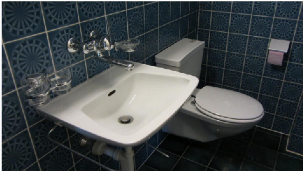
Seifenhalter und Halterung, Zahngläser und Halterung, Toilette und Toilettendecke, Papierrolle und Halter. Peter Merian-Str. 25, 4052 Basel (1978)