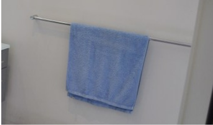
Handtuch und seine Halterung. Schulhausstr. 14, 8002 Zürich (1870)