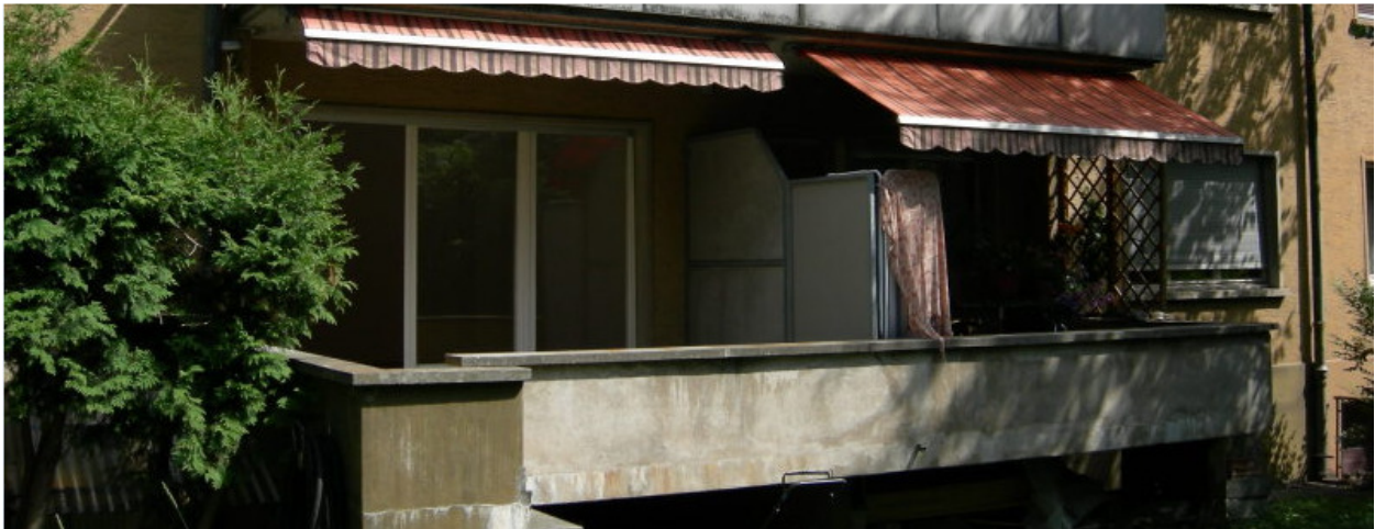
Balkone und ihre Storen. Bucheggstr. 136, 8057 Zürich (1933)