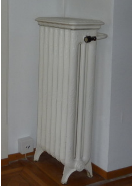
Ottikerstr. 24, 8006 Zürich (1906)