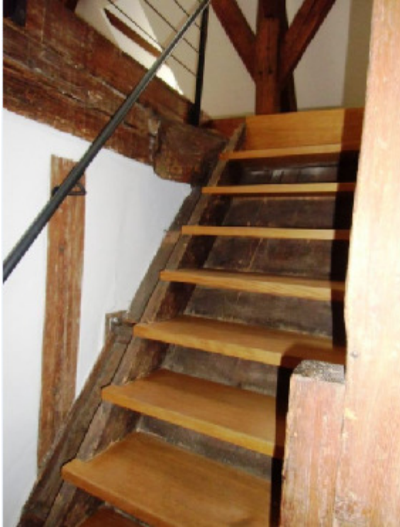
Treppe und ihr Handlauf. Stiftsgasse 5, 4051 Basel